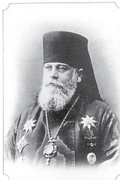
Архиепископ Серафим, 1912 г.

Врачи XIX века призывали к осторожному отношению к хирургическому удалению миндалин у детей с хроническим тонзиллитом, поскольку у детей