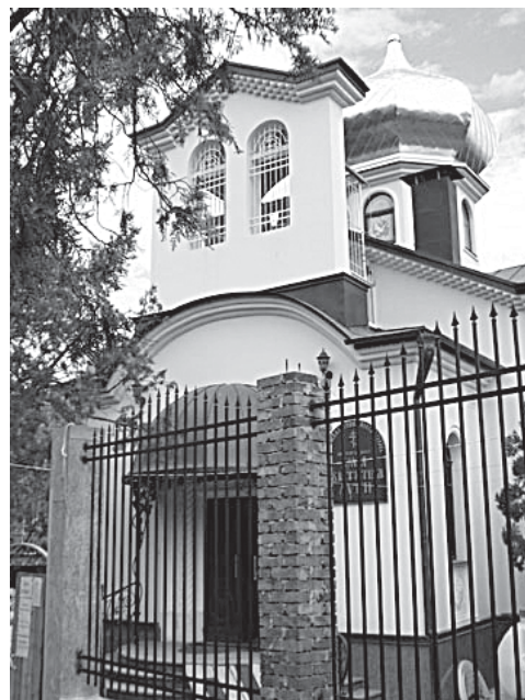
Храм во имя Святителя Луки в п. Новый Свет

В тот праздничный день для торжественного освящения нового храма прибыл Митрополит Симферопольский и Крымский Лазарь, священнослужители Симферополя, а также многочисленные