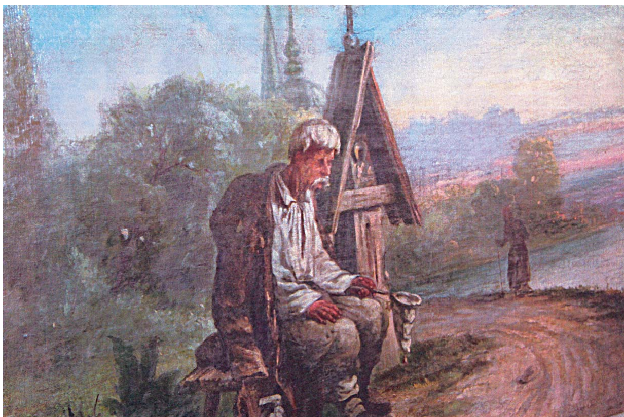
Картина кисти Святителя Луки (Войно-Ясенецкого) «Нищий, просящий милостыню»