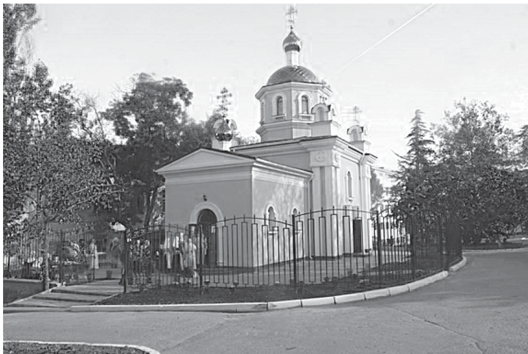
Храм во имя Святителя Луки на территории городской больницы №1 в г. Севастополе

По окончании богослужения Владыка поздравил всех с праздником: "...Сегодня великая у нас радость. Мы с вами находимся в этом прекрасном Доме Божьем. И отныне этот храм освящён. С