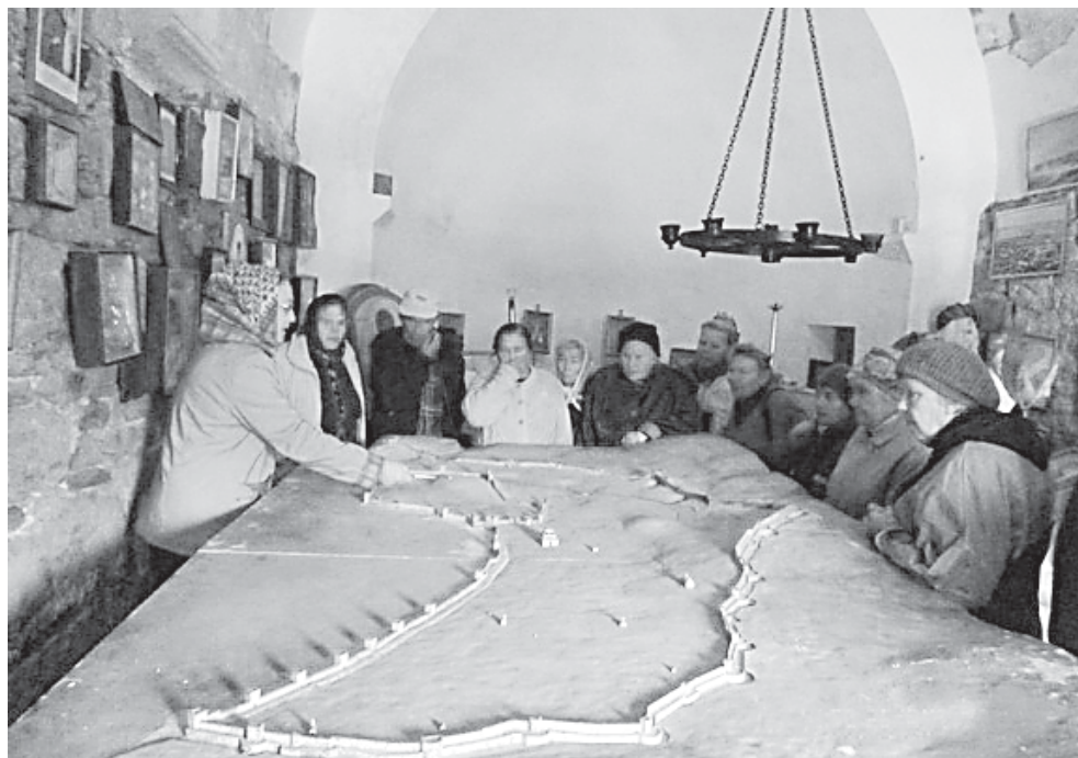
Свято-Георгиевский храм. У макета древней Кафы

Она рассказала о многовековой истории города, возникновении христианства в Феодосии, показала памятники истории и архитектуры средневековья. Особый интерес вызвал рассказ у маке-