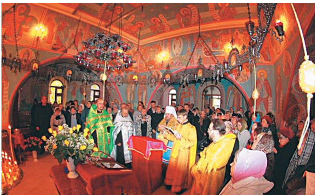
Молебен перед началом конференции в храме св. Параскевы

ла свою работу конференция православных врачей Крима: