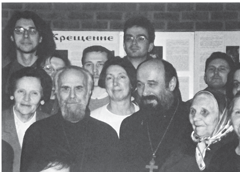
Митрополит Антоний. 2000 г.

И, может быть, стоит задуматься над тем, что в книге Откровения нам сказано, как в конце времен, после Второго пришествия Господня, каждый из нас получит имя, которое знают только Бог и тот, кто это имя получает (Откр. 2, 17). Не означает ли это имя, неизвестное больше никому, что каждый из нас для Бога — единственный, неповторимый и что отношение с Богом каждого из нас абсолютно неповторимо, ни с чем не сравнимо, что человечество является как бы все нарастающей, громадной и дивной мозаикой, где каждый из нас представляет собой один камушек, — но камушек, на котором держится вся мозаика? Вынь один из них — начинает расшатываться все здание, все мироздание. И каждого из нас Бог творит, вызывает к бытию по невыразимой и, по-человечески говоря, непонятной любви к нам. Непонятной, потому что Он знает, каковы мы, мы и сами знаем, как мы неотзывчивы на любовь — и на человеческую, и еще больше на Божественную. И Бог каждого из нас вызывает к бытию для того, чтобы мы вступили в таинство взаимной с Ним любви.