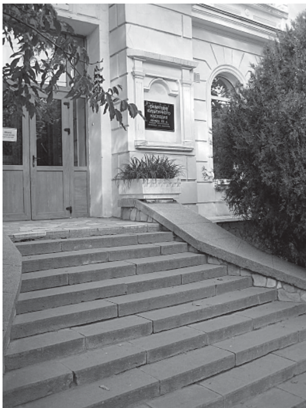
Симферополь. Лечебница доктора А.Ф. Каблукова, ныне 1-й родильный дом