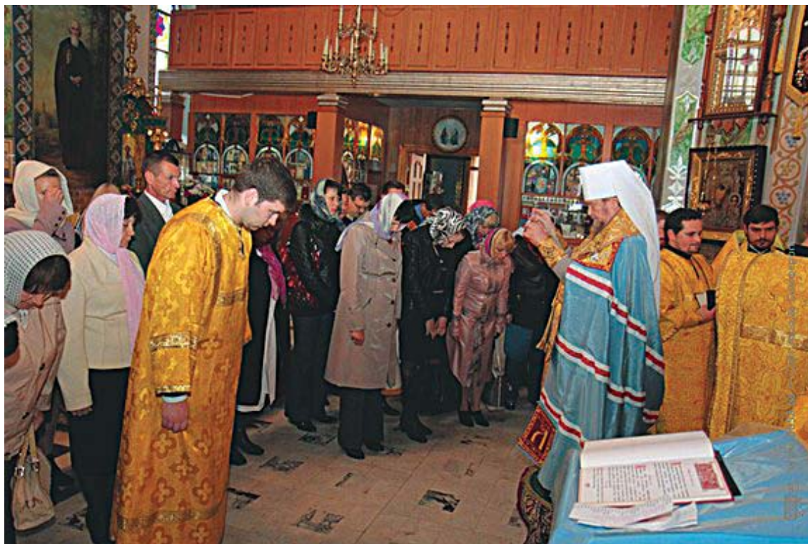
Во время благодарственного молебна. Свято-Троицкий женский монастырь

Подробнее о чудесах Святителя Луки читайте на следующих страницах журнала.