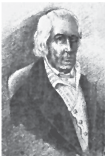
Федор Карлович Мюльгаузен