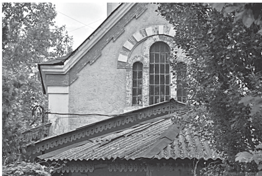
Симферополь. КРУ "Психиатрическая больница №1". Старые постройки больницы

Стационарной помощи в Таврической губернии не было, и душевнобольных отправляли в Екатеринославскую губернию. В 1803 году в Приказе общественного призрения рассматривался рапорт старшего лекаря Егора Экка о необходимости устройства в губернии больницы и "дома для сумасшедших", но из-за отсутствия средств открытие этих учреждений было отложено, и только в 1805 г. Приказ общественного призрения принял решение открыть больницу на 15 коек (на территории нынешнего КРУ "Психиатрическая больница №1"). Первый больничный стационар в Крыму был открыт 1 октября 1807 года на Александро-Нев-