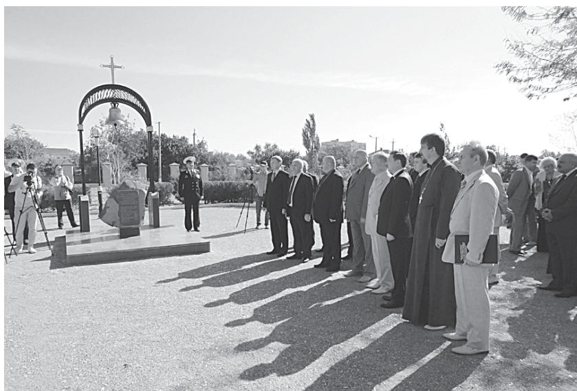
Во время торжеств, посвященных 175-летию Сакского военного клинического санатория им. Н.И. Пирогова